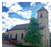
St. Apollonia Großhau