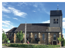
St. Josef Vossenack