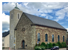
Hl. Kreuz Hürtgen