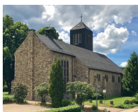
St. Antonius Gey