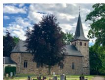
Hl. Maur. Märtyrer Bergstein