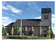
St. Josef Vossenack