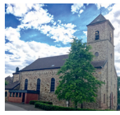
St. Apollonia Großhau