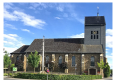
St. Josef Vossenack