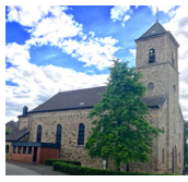
St. Apollonia Großhau