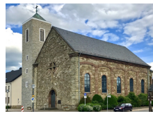
Hl. Kreuz Hürtgen