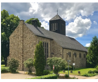
St. Antonius Gey