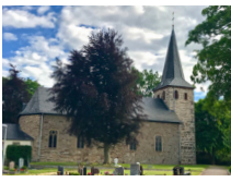
Hl. Maur. Märtyrer Bergstein