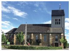
St. Josef Vossenack