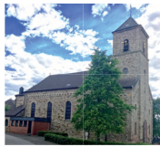
St. Apollonia Großhau