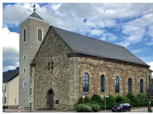
Hl. Kreuz Hürtgen