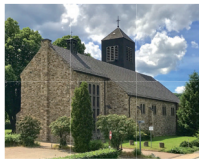
St. Antonius Gey