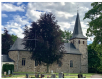
Hl. Maur. Märtyrer Bergstein