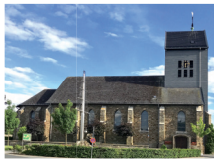
St. Josef Vossenack