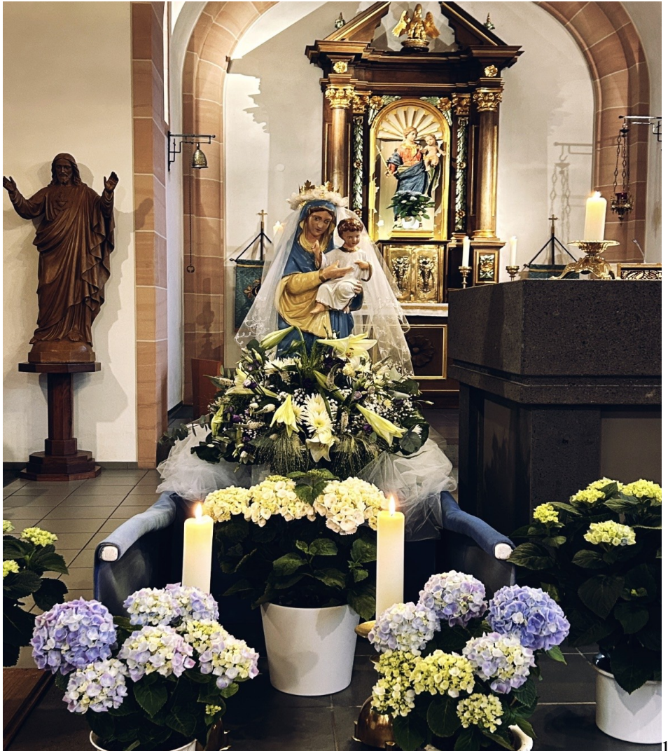
Maialtar – Kapelle Maria, Hilfe der Christen, Üdingen

St. Andreas Stockheim St. Fides Spes et Caritas Thum St. Gereon et soc Boich St. Heribert Kreuzau St. Martin Drove